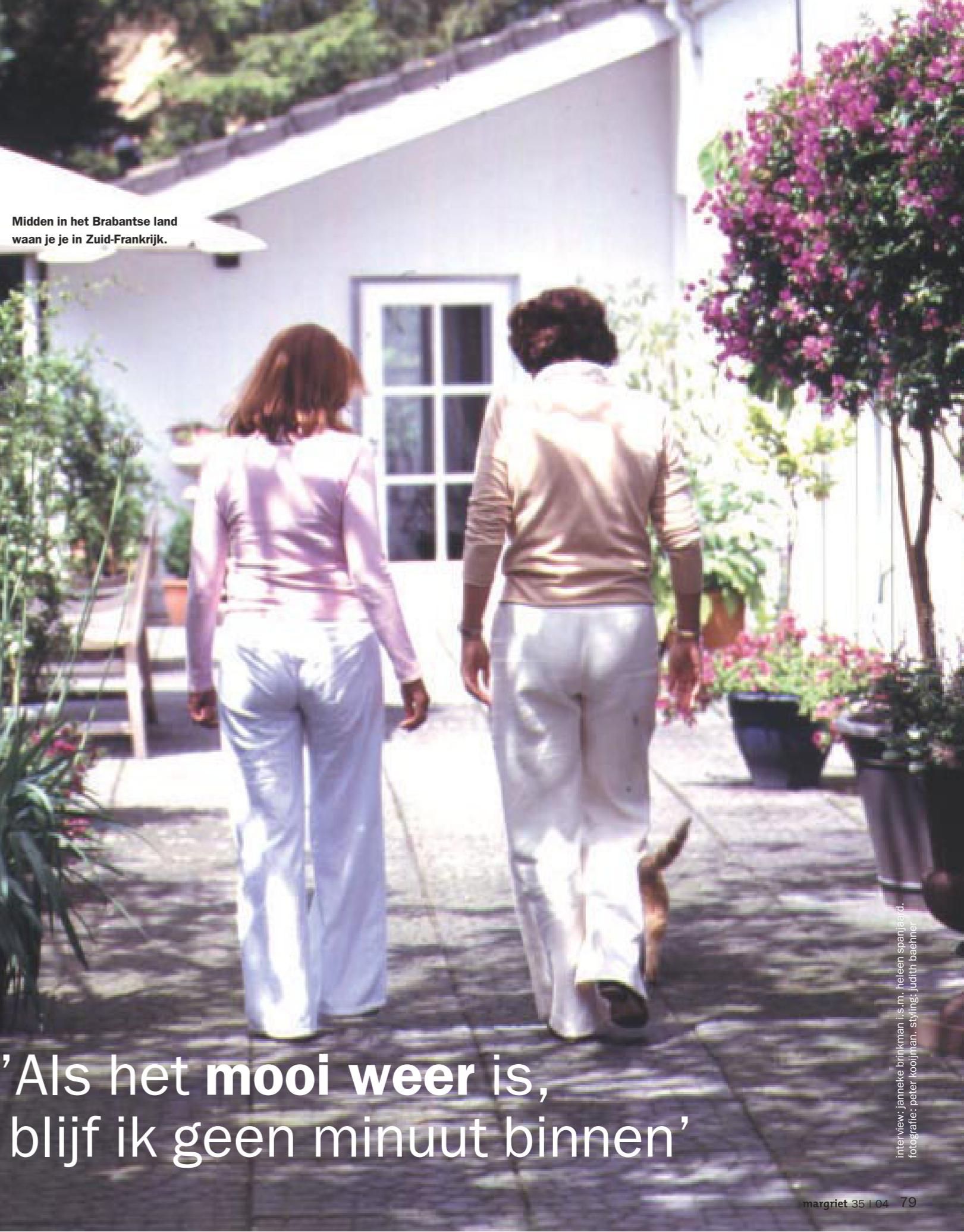
Midden in het Brabantse land waan je je in Zuid-Frankrijk.