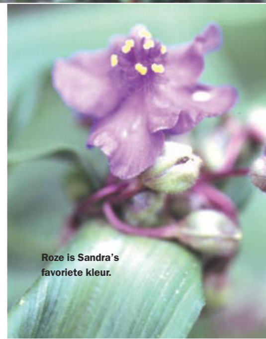
Roze is Sandra's favoriete kleur.