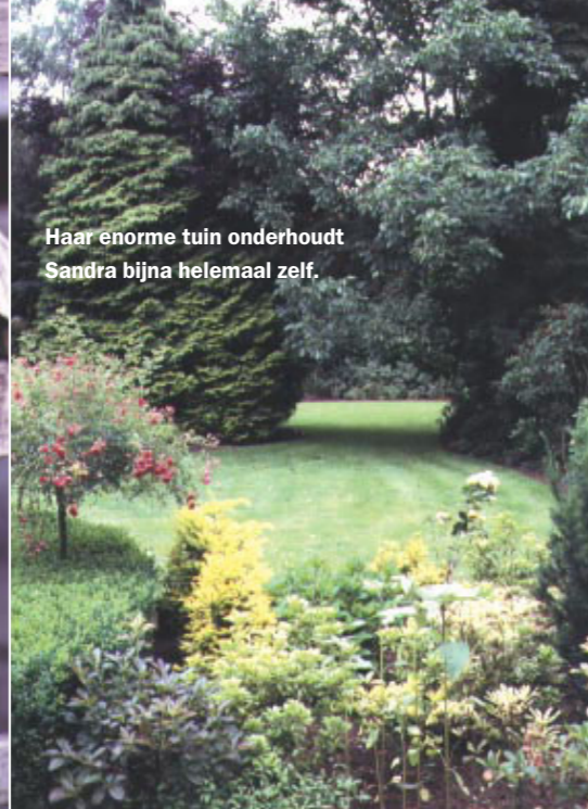
Haar enorme tuin onderhoudt Sandra bijna helemaal zelf.