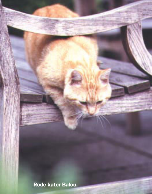
Rode kater Balou.