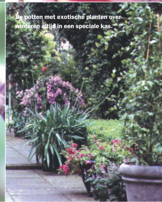
De potten met exotische planten overwinteren altijd in een speciale kas.