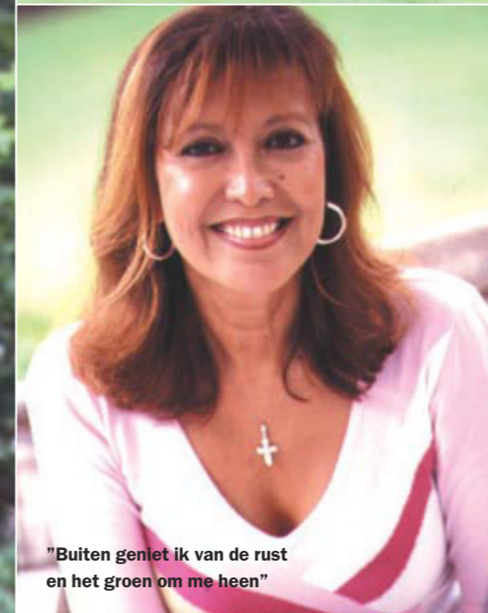
"Buiten geniet ik van de rust en het groen om me heen"