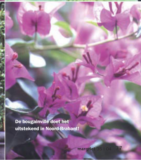
De bougainville doet het uitstekend in Noord-Brabant!